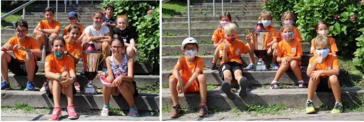
Due gruppi di bambini/ragazzi appartenenti alla stessa fascia di età, estate 2019